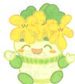
千葉県子どもと親のサポートセンター マスコットキャラクター こさぼん