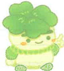
千葉県子どもと親のサポートセンター マスコットキャラクター こさぼん